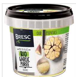
Bresc Biologische knoflookpuree 325g