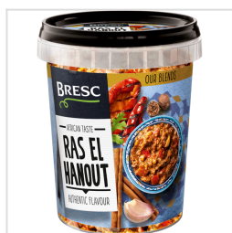
Bresc Ras el hanout kruidenmix 450g