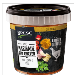
Bresc Marinade voor kip 1000g