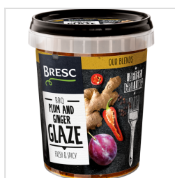
Bresc Pruim en gember glaze 450g