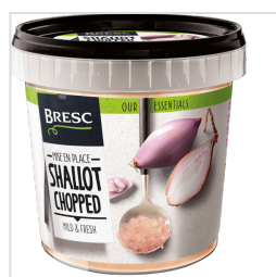
Bresc Échalote hachée 1000g