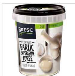
Bresc Purée d'ail supérieur 450g