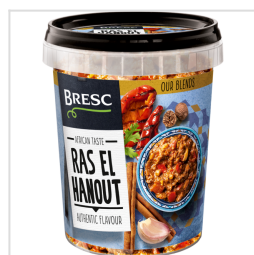
Bresc Ras el hanout Mélange d'épices 450g