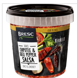
Bresc Salsa aux Chipotle et Poivrons 1000g